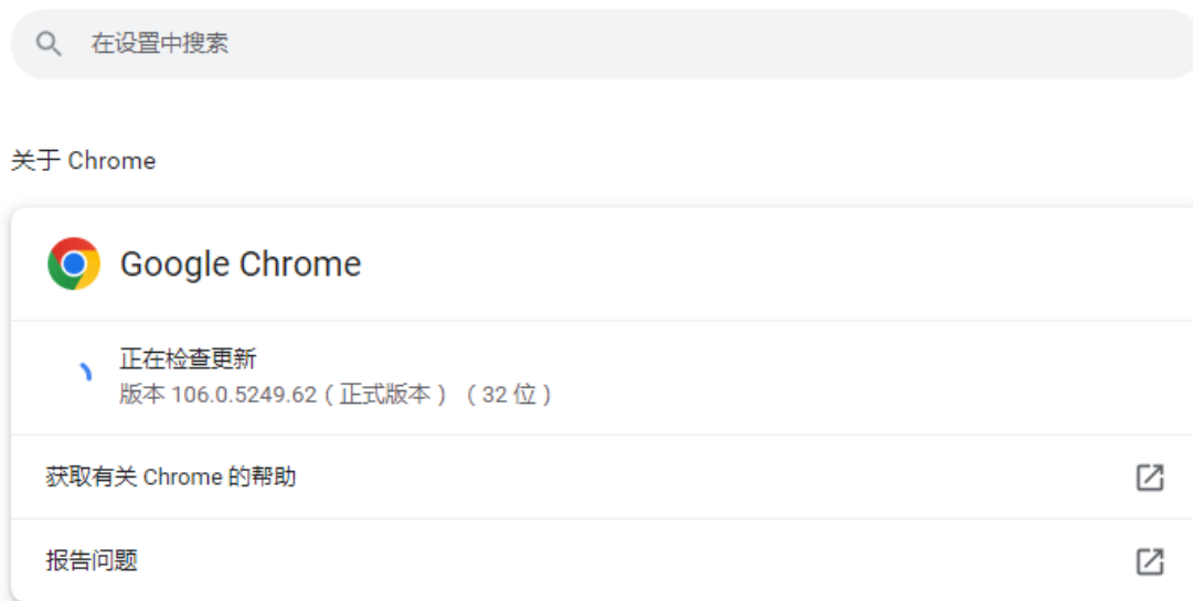
图 2. 浏览器版本