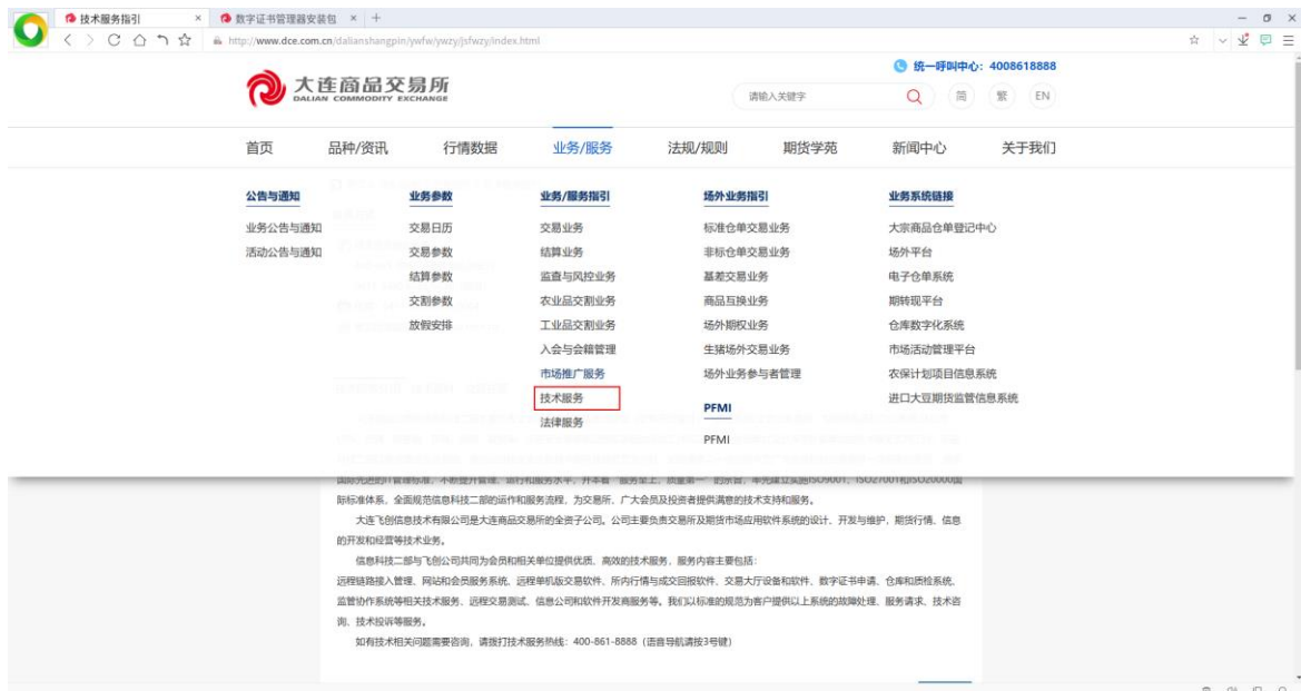
图 3. 数字证书安装包下载菜单